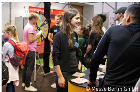
Auf Augenhöhe kommunizieren: Peers der „Alkohol? Kenn dein Limit.“-Kampagne auf der „YOU“-Messe in Berlin.

Rund 50 speziell geschulte Peers der Jugendkampagne „Alkohol? Kenn dein Limit.“ sind auch in diesem Jahr wieder in ganz Deutschland unterwegs, um mit Jugendlichen persönlich über das Thema Alkohol zu reden und sie für einen verantwortlichen Umgang mit Alkohol zu motivieren. Jeweils in Zweier-Teams sind sie dort im Einsatz, wo Jugendliche ihre Freizeit verbringen: in Innenstädten und Parks, auf Musikfestivals oder Sportveranstaltungen. Auch auf der „YOU“-Messe